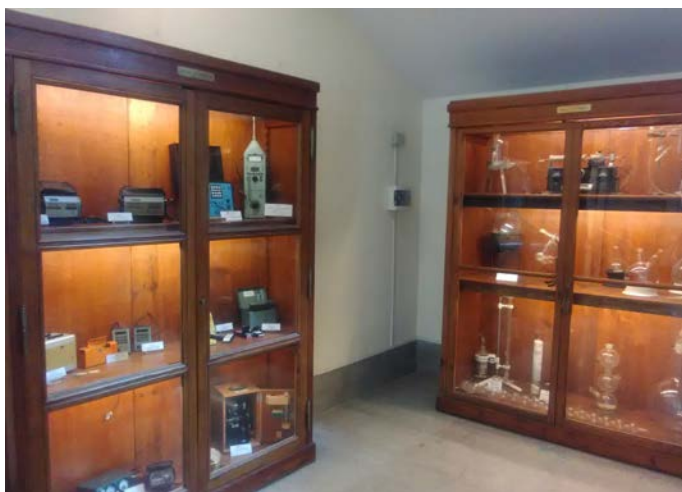
Figura 1. Uno scorcio del Museo.

Un Museo di Chimica è molto di più di una mera esposizione di strumenti antichi, vetreria particolare, manufatti, sostanze e prodotti dai colori o dalle proprietà singolari. È qualcosa di più vivo, sia per la possibilità di esperienze visive o interattive di grande valenza didattica sia, soprattutto, per la particolarità di poter esplorare "dentro" strumentazioni anche relativamente recenti, pur se obsolete, in modo da toccare con mano l'applicazione dei principi della chimica. Questo comporta una grande varietà dell'utenza interessata, dagli studenti della scuola dell'obbligo sino a colleghi e cultori delle discipline scientifiche che possono ritrovarsi in strumenti che magari hanno loro stessi utilizzato. La presenza di scolaresche, ma anche di studenti delle scuole superiori per l'alternanza scuola-lavoro (comunque minorenni) ha imposto, oltre una ovvia verifica delle condizioni di sicurezza (impianti elettrici, vetri di sicurezza, ecc.) anche una caratterizzazione completa della qualità dell'aria, i cui risultati sono presentati in esteso nel convegno.