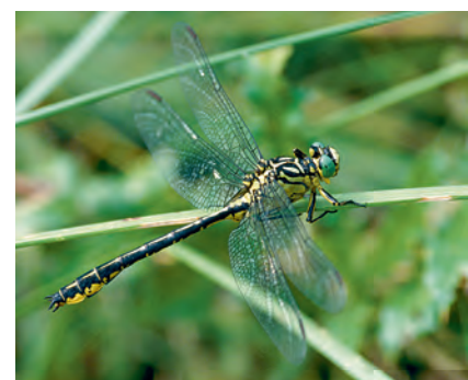
Gonfidi: Gomphus flavipes