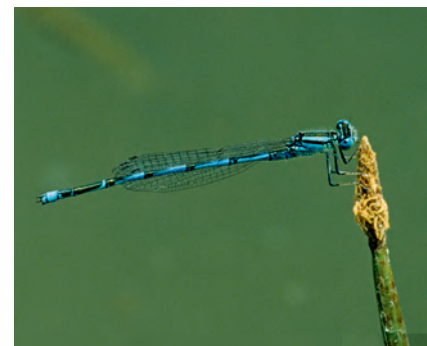
Cenagrionidi: Erythromma lindenii