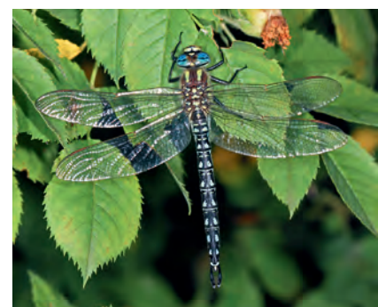
Esnidi: Brachytron pratense