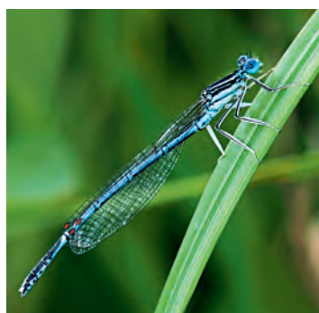
Platynemidi: Platynemis pennipes