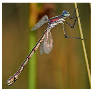
Lestidi: Lestes dryas