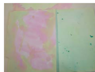
Il filo dei colori