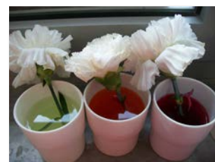
il fiore colorato