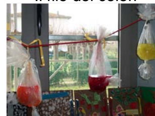
l'acqua colorata... i fiori