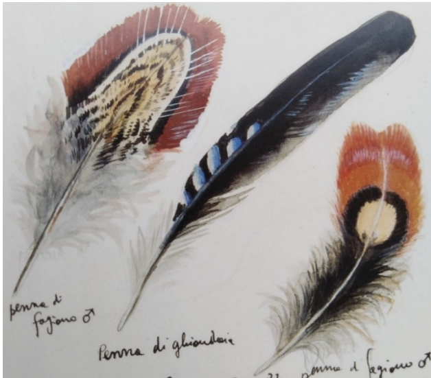
A Disegni di Fulco Pratesi